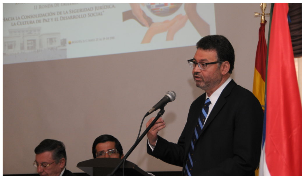
→ RECORTE DE XVIII Cumbre Judicial Iberoamericana. Segunda Ronda de Talleres - Parte II (Consejo Superior de la Judicatura - Sala Administrativa, 2015)

Con la finalidad de garantizar la eficacia y prontitud en el acceso a la administración de justicia se han adoptado medidas de descongestión encaminadas a: “(i) reducir el número de casos que llegaban a los estrados judiciales, (ii) facilitar la labor ordenada y sistemática del despacho, partiendo de la racionalidad en la organización del trabajo interno y (iii) a evacuar ágilmente todos los asuntos pendientes de diligenciamiento, entre otras alternativas” (CC C-154 de 2016).