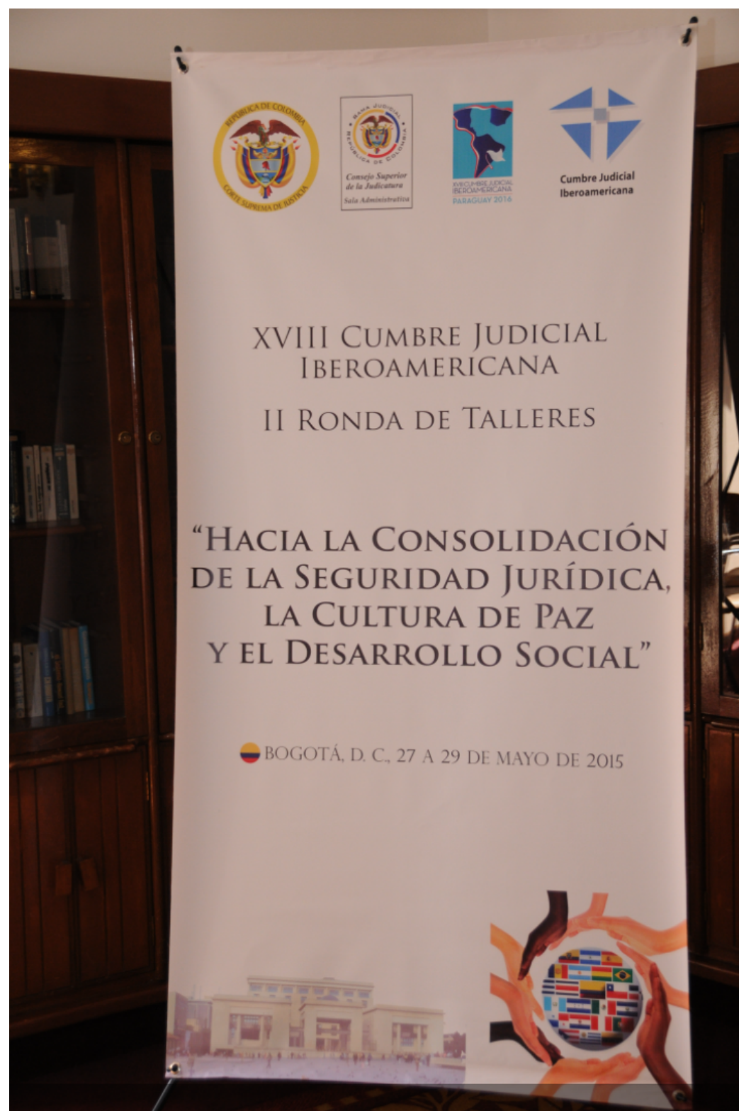
→ RECORTE DE XVIII Cumbre Judicial Iberoamericana. Segunda Ronda de Talleres - Parte II (Consejo Superior de la Judicatura - Sala Administrativa, 2015)